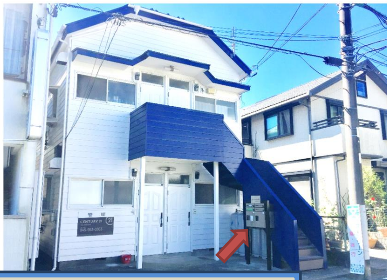
駅チカ便利！2021年外壁塗装 ポスト・宅配ボックス新設